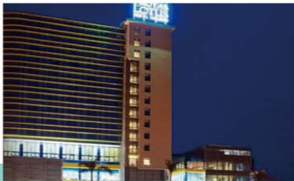
下龍 GOLDEN ROTUS